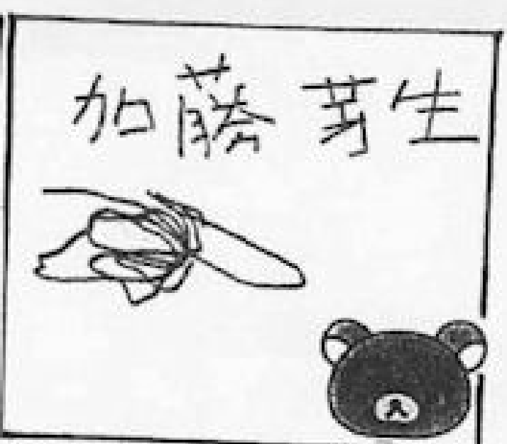
わたしの好きな色は「 まんこ」です！