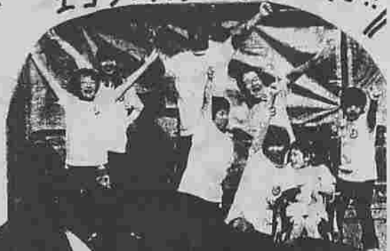
新聞を作ったメンバー