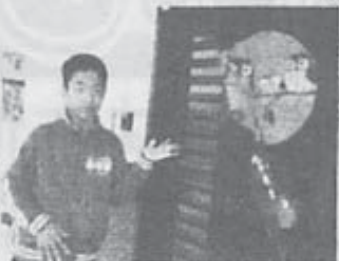
お友達とのお出かけに、みんな嬉しくて笑顔☆彡