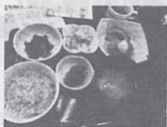
美味しくて綺麗なサクラごはん