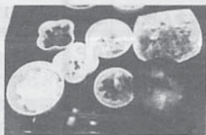
トロごはん焼肉定食