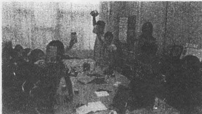
みんなで作、はいポーズ😊