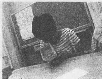
ももさん、とー、ても 真剣!!!