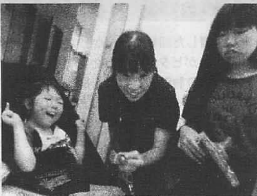
女子は買い物大好き♡